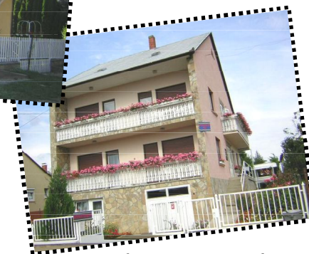
Budai Nagy Antal 14.

Wenn Sie sich nach Ruhe und nach der Heilwirkung des Hévízer Thermalsees sehnen, in unseren Appartementshäusern findet jeder die beste Erholungsform für sich. Wenn Sie bei uns Urlaub machen, können Sie von voll ausgestatteten, anspruchsvoll eingerichteten Appartements wählen. Wir erwarten unsere lieben Gäste mit kostenloser Parkmöglichkeit im Zentrum , mit einer langen Reihe von Ermäßigungen (Restaurants, Badekarte, Kur, Schönheitssalon, Zahnarzt, usw.) und weitreichende Dienstleistungen (Massage, kostenlose Fahrräder, WiFi, Liegestühle, Grill, Spielplatz, Safe usw.). Wir gründen die Entwicklung unserer Häuser auf unsere vieljährige Erfahrung, nach Bedarf unserer Gäste, damit Sie von einem gut gelungen, erholsamen Urlaub voll mit Erlebnissen nach Hause fahren können. Unsere Appartements sind für 2-7 Personen geeignet. Jedes Appartement besteht aus Schlafzimmer (Wifi/Sat TV), Bade-zimmer, Küche (Herd, Kühlschrank, Kaffeemaschine, Mikrowelle) und Balkon. In der Nähe: Restaurants, Zahnarzt, Lebensmittelgeschäfte, Schönheitssalon, Kurmöglichkeiten.